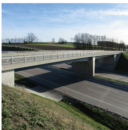
BRÜCKEN A8, BW 129