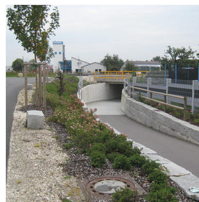
BRÜCKE ERBACH EÜ+GWW