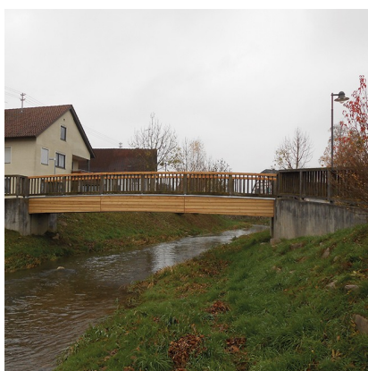
DÜRNACH HOLZBRÜCKE, BALTRINGEN